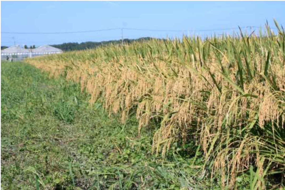
写真1 オオナリ（単収1tを超える高タンパク米）福島県南相馬市