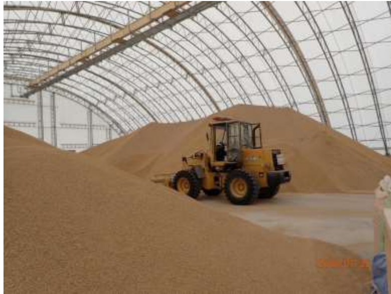
写真2 モミ米の常温保管ハウス（最大7,000t 保管可能）青森県鶴田町の木村牧場