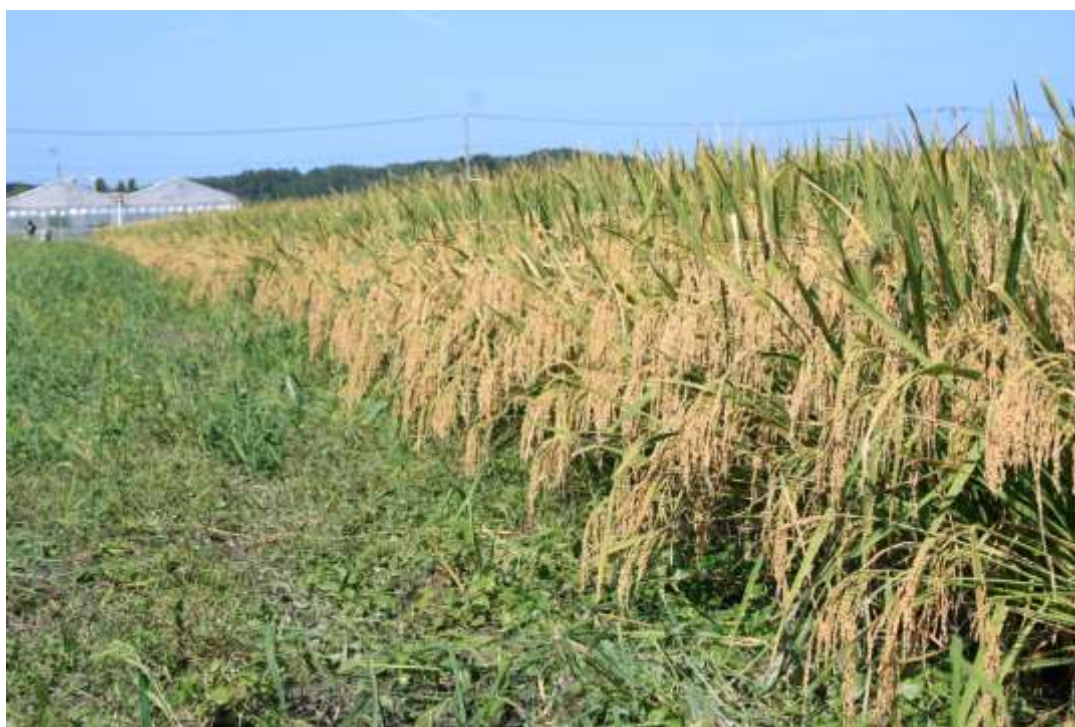
写真1 オオナリ (単収 1 t を超える高タンパク米) 福島県南相馬市

家畜の栄養として重要なのはカロリーとともにタンパク質です。とくに成長が良くなるタンパク質は主原料の中では高い方が良いでしょう。主食用米のタンパク質は 6% 台ですが、長粒種系統の「タカナリ」、その後継品種である「オオナリ」は多収で粗タンパク質含量で 9% を超える高タンパク米品種です (参考資料 2)。飼料原料として使用する場合はできるだけ多収で高タンパク米の開発・普及が必要です。