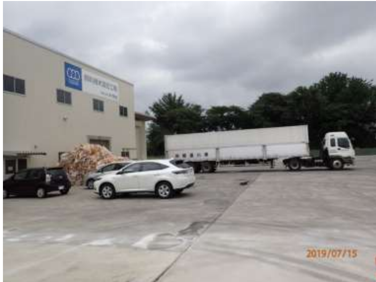
写真3 20 t の大型トレーラーでモミ米を搬入（飼料用米配合工場・群馬県前橋市）