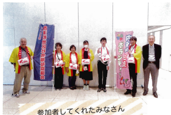
参加者してくれたみなさん

赤い羽根共同募金は身近な地域をよくするための資金として、子ども、高齢者、障がい者などを支援する様々な社会福祉活動の支援に役立てられます。災害時にはボランティアセンターの開設や被災者支援活動にも役立てられます。みなさまのご協力、ありがとうございました。