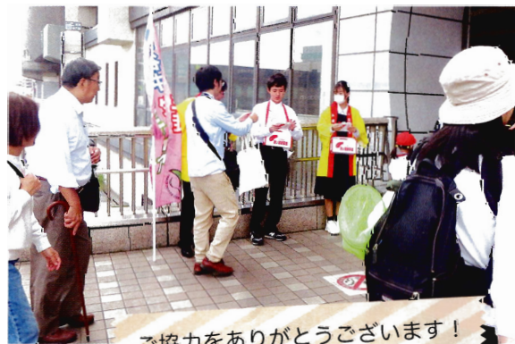
ご協力をありがとうございます！