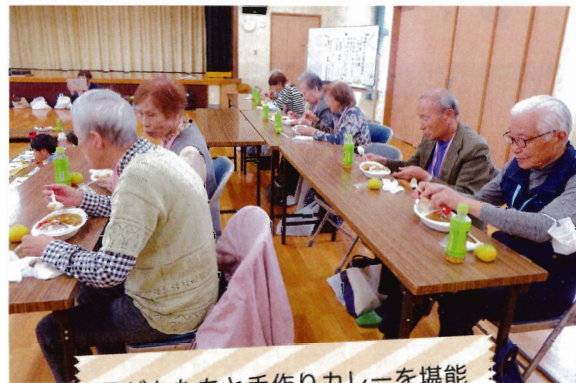
子どもたちと手作りカレーを堪能