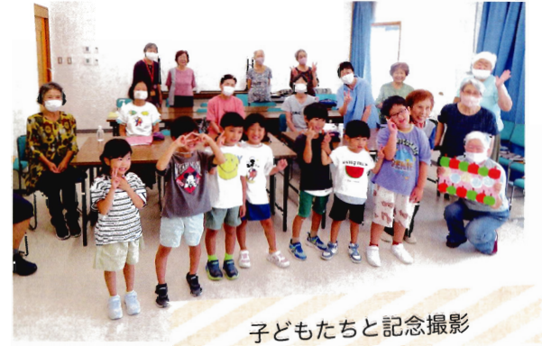
子どもたちと記念撮影