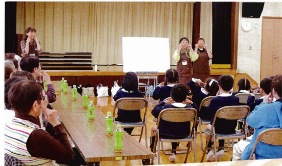
「マルベリー」さんによる読み聞かせ