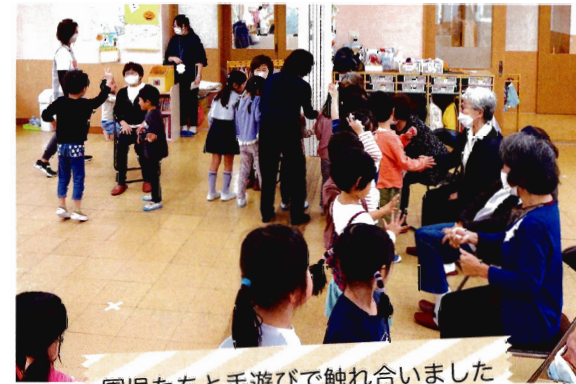
園児たちと手遊びで触れ合いました

西浦和地区社協では、さい桜保育園(曲本4丁目)、いちごの里保育園(曲本5丁目)の園児と地域の高齢者との地域交流会を開催しています。園児の皆さんのおゆうぎや歌を楽しんだり、一緒に手遊びや体操、ゲームなどをして交流を深めます。元気で笑顔がなによりのプレゼントです。