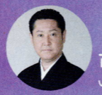
市山松扇 いちやましょうせん

日本舞踊の普及と新たな創造の可能性に挑む、第一線で活躍中の男性舞踊家たちが流派を超えて結集したユニットです。1998年に結成。致付・袴のみの「素踊り」を基本コンセプトに、わかり易く迫力に満ちた新作舞踊を次々と発表。中でも2000年度初演『御社祭（おんぼしら）』は、日本舞踊の新作としては異例の100回に迫る再演を全国各地で重ね大反響を呼んでいます。また若い世代に向けたレクチャー&デモンストラーション、ワークショップなどを積極的に展開中。そのクオリティは各方面より高い評価を得、伝統芸能の世界で熱い注目を浴び続ける日本舞踊家集団です。2000年度舞踊批評家協会新人賞、2008年度文化庁芸術祭賞優秀賞を受賞。