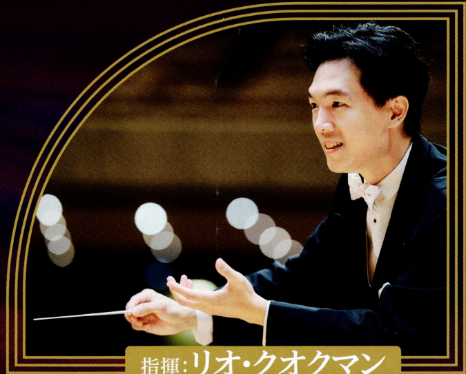
指揮: リオ・クオクマン