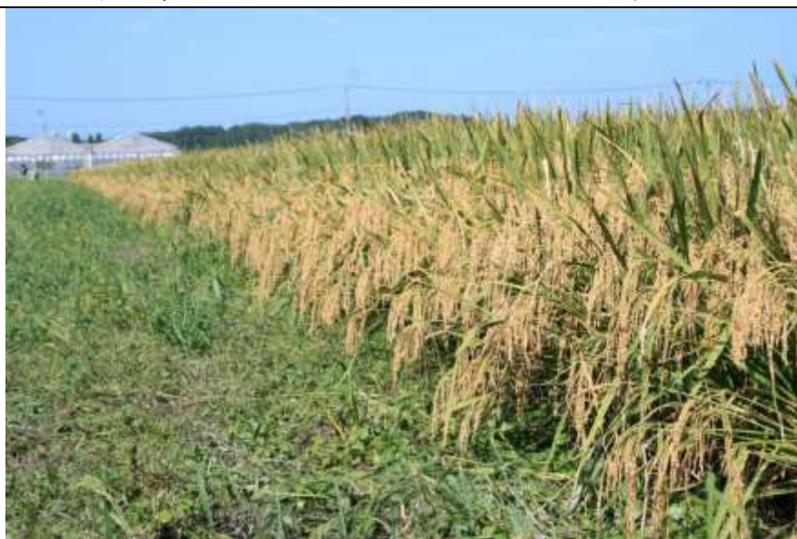
オオナリ（単収1tは超える高タンパク米）福島県南相馬市

これ、稲作やっている人が、見れば分かると思いますが、もう、米場が立って、上は青い、青い1トン目が立っています。で、真ん中辺から下が、もう、穂だらけということで、こういう稲姿になれば、1トン超えます。