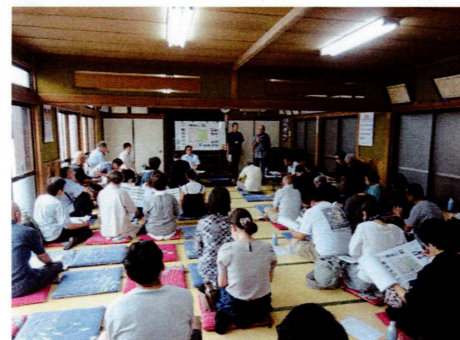
意見交換会の様子①

日時：令和7年9月14日(日) 14時00分～15時30分 場所：内谷五丁目自治会集会所 参加者数：39名