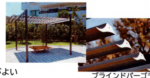
ブラインドパーゴラ