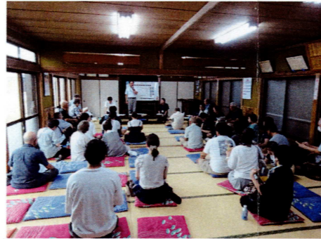
意見交換会の様子②