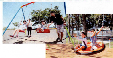
インクルーシブ型ブランコ (通常シート+お椀型シート)