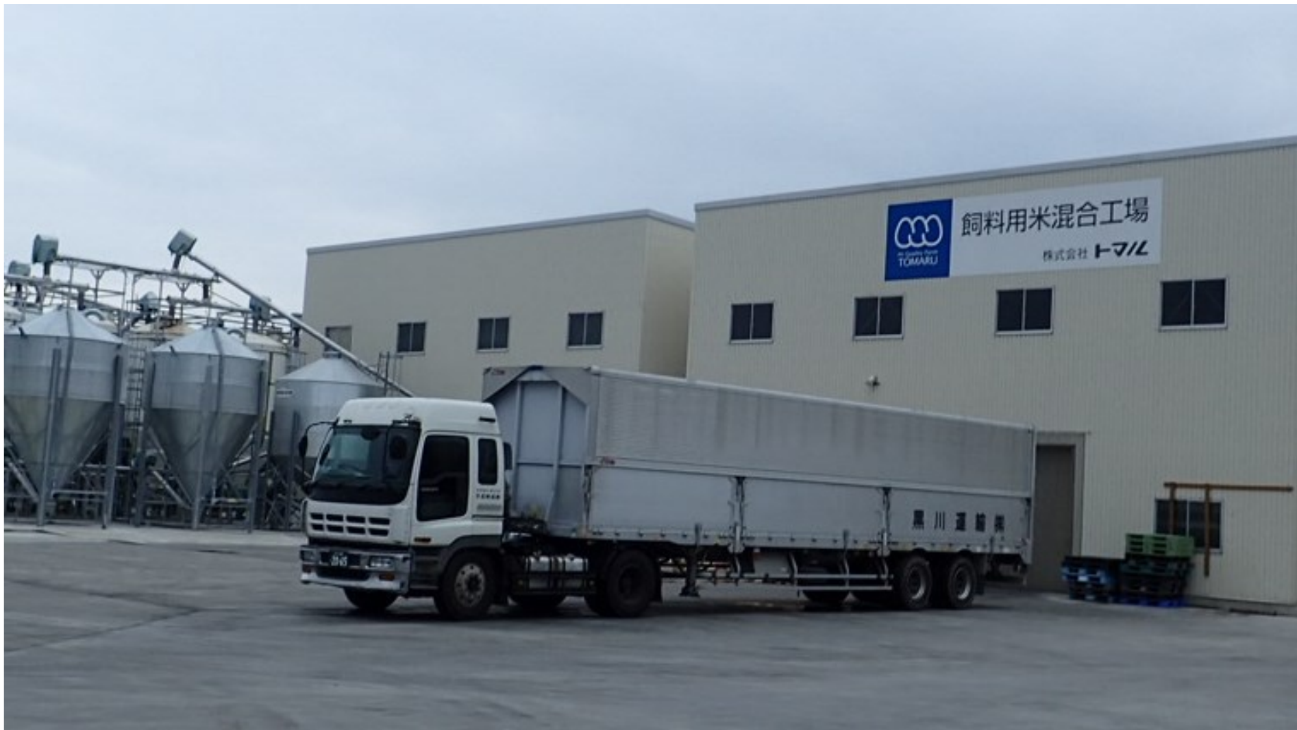
群馬県前橋市の株式会社トマル（養鶏）の飼料用米自家配合工場（月産約2,000 t）