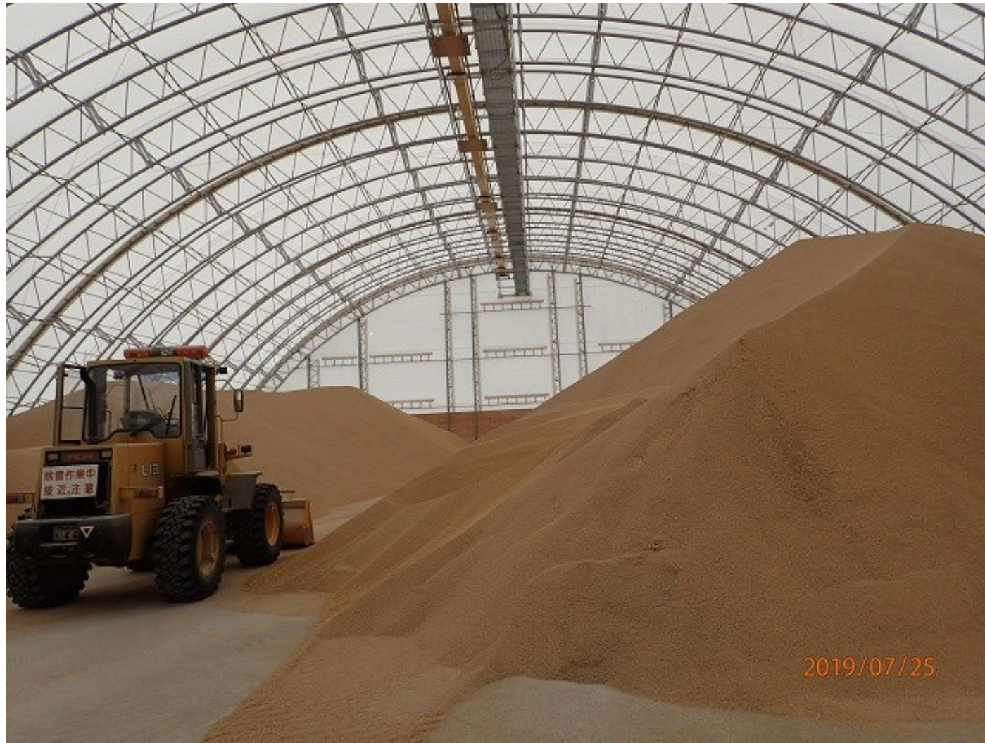
青森県の木村牧場（養豚）の大型飼料用米保管ハウス（約7,000 t 収容可能）