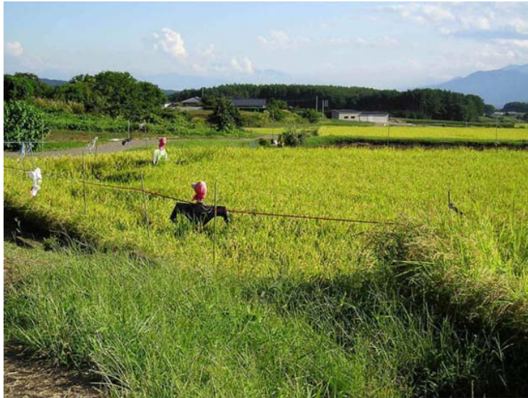
頑張っている農家は希望の光