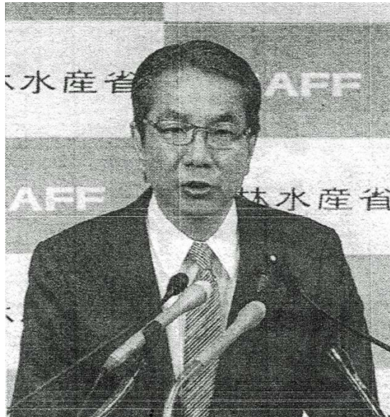
江藤農相が備蓄米21万トンの放出を発表 (2月14日)