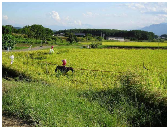
耕作地の4割は中山間地域

だから、地域から自分たちの食と農と命を守る仕組みづくりを強化していこう。(つづく)