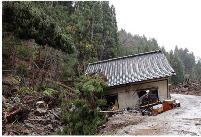
能登の復旧遅れは移住を促しているのか…