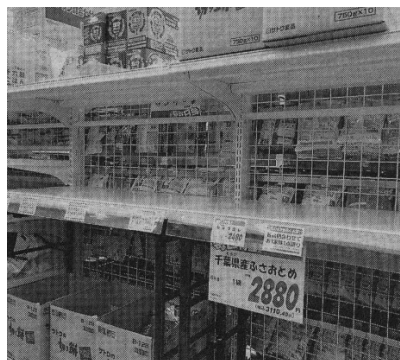
2024年夏は店頭から消えた